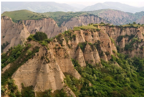
Мелнишките скални пирамиди

Мелник е най-малкият град в България. Той е част от Стоте национални туристически обекта.