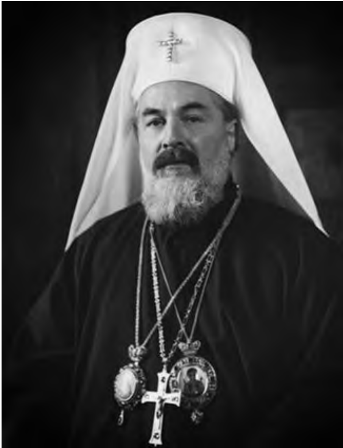
Митрополит Кирил Български