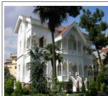
Къщата в , която е подписан договорът