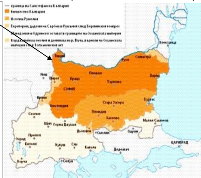
Картата на възстановената на 3 март 1878 г. Българска държава според Санстефанския предварителен мирен договор

Границите на България съгласно Санстефанския договор се отличават от тези на двете български автономни области, предвидени от Великите сили на Цариградската конференция от 1876 г . Според договора бъдещото българско княжество получава значителна част от Егейска Македония , но губи Нишко и Северна Добруджа .