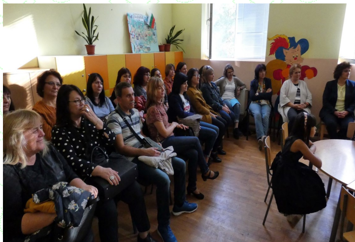
Училище домакин—НУ „Иван Вазов“ - гр. Дългопол