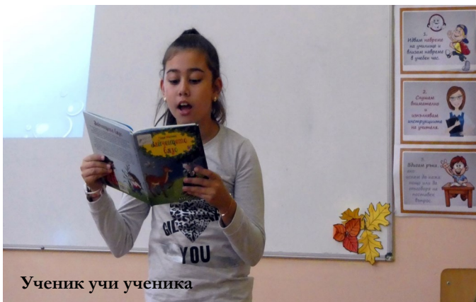
Ученик учи ученика