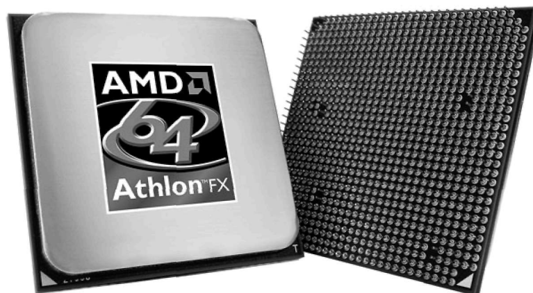
Фиг. 1 AMD Athlon 64 FX (за цокъл Socket 939).

Процесорите AMD Athlon 64 и 64 FX, с кодово име ClawHammer са въведени през септември 2003 г. Те са първите 64-битови процесори за настолни компютри (но не и за сървъри). Принадлежат към семейството на 64-битовите процесори на AMD, което включва сървърния процесор Opteron, с кодово име SledgeHammer. Всъщност това са чипове Opteron, които са проектирани за еднопроцесорни системи и в някои случаи имат намален кеш или памет с намалена пропускателна способност.