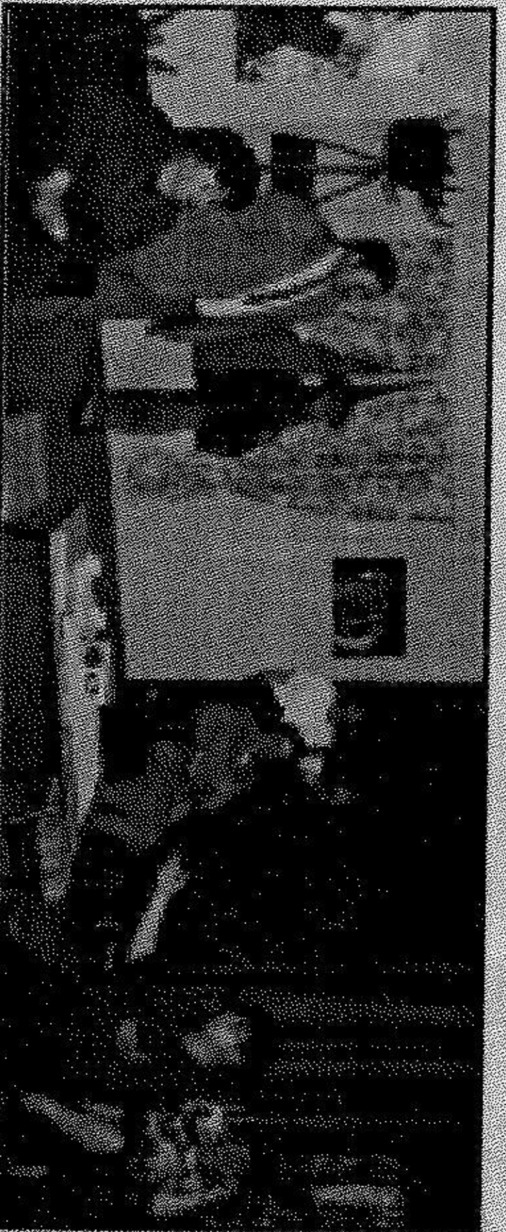
Темнишките в "Семейна история" (сезон 95/96 г.)