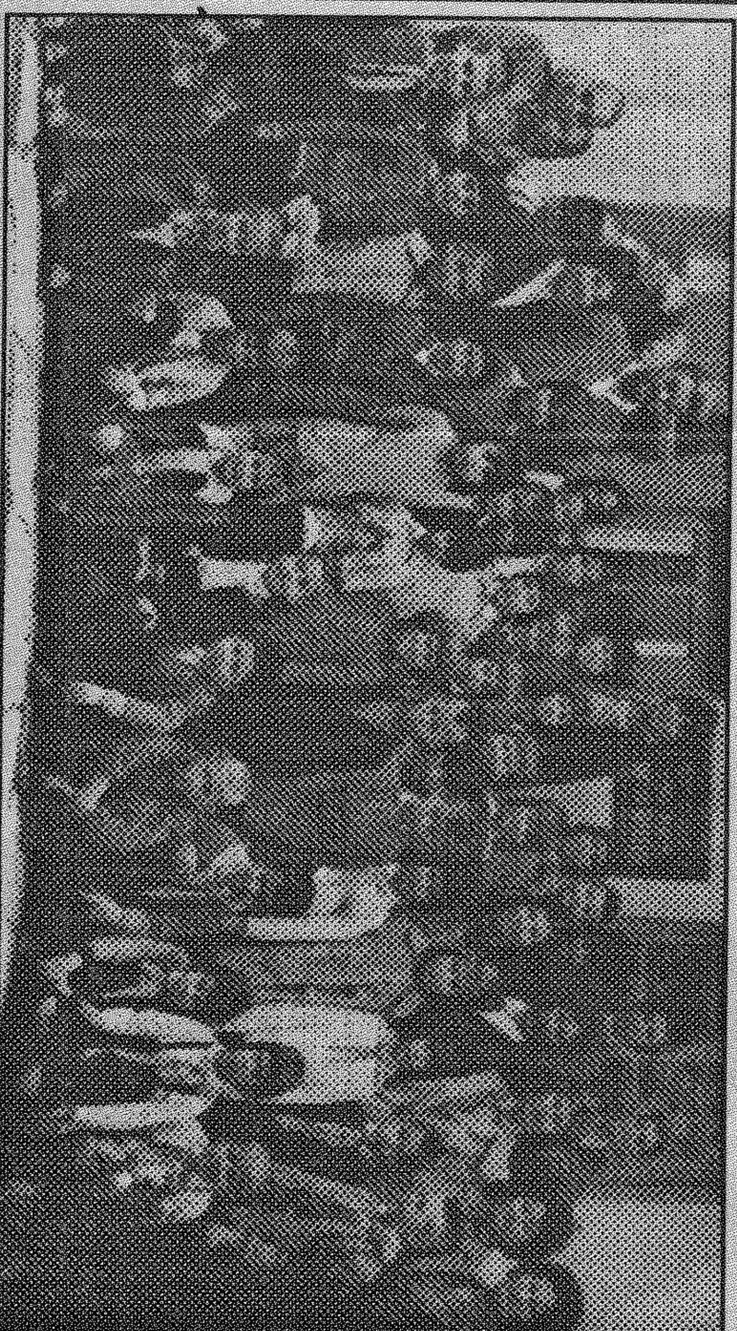
1965 година, на екскурзия в Габрово

ПРЕПЕЧАТНА ПОДГОТОВКА, ДИПЛОМНИ РАБОТИ. 0618/3-26-90